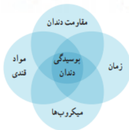
عوامل اصلی مؤثر بر پوسیدگی دندان