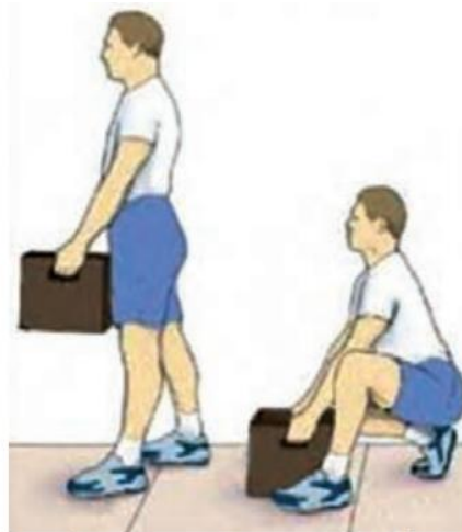
شکل ۵. روش صحیح بلند کردن و حمل بار سبک

از دیدگاه سلامت ستون فقرات، بلند کردن بار با کمر راست و پاهای خمیده، روشی ایمن‌تر است. از این رو برای برداشتن اشیای سبک و کوچک از روی زمین باید کنار جسم زانو بزنیم، طوری که یک پا جلوی پای دیگر قرار گیرد، و بدون دولا شدن جسم را بلند کنیم (شکل ۵).