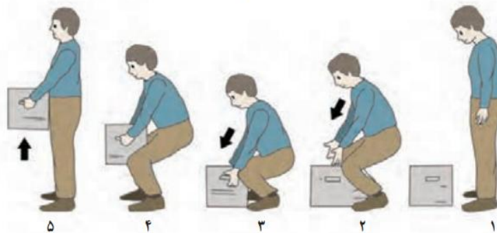
شکل ۶. روش صحیح بلند کردن و حمل بار سنگین

برای برداشتن اشیای سنگین از روی زمین لازم است پاها را صاف بر روی زمین بگذاریم و تا حد ممکن نزدیک جسم بایستیم، سپس زانوهارا خم کرده و بدن را در وضعیت زانو زدن قرار دهیم و جسم را نزدیک به خودمان بگیریم و از زمین بلند کنیم و حتماً از پیچش و چرخاندن کمر خودداری کنیم (شکل ۶).